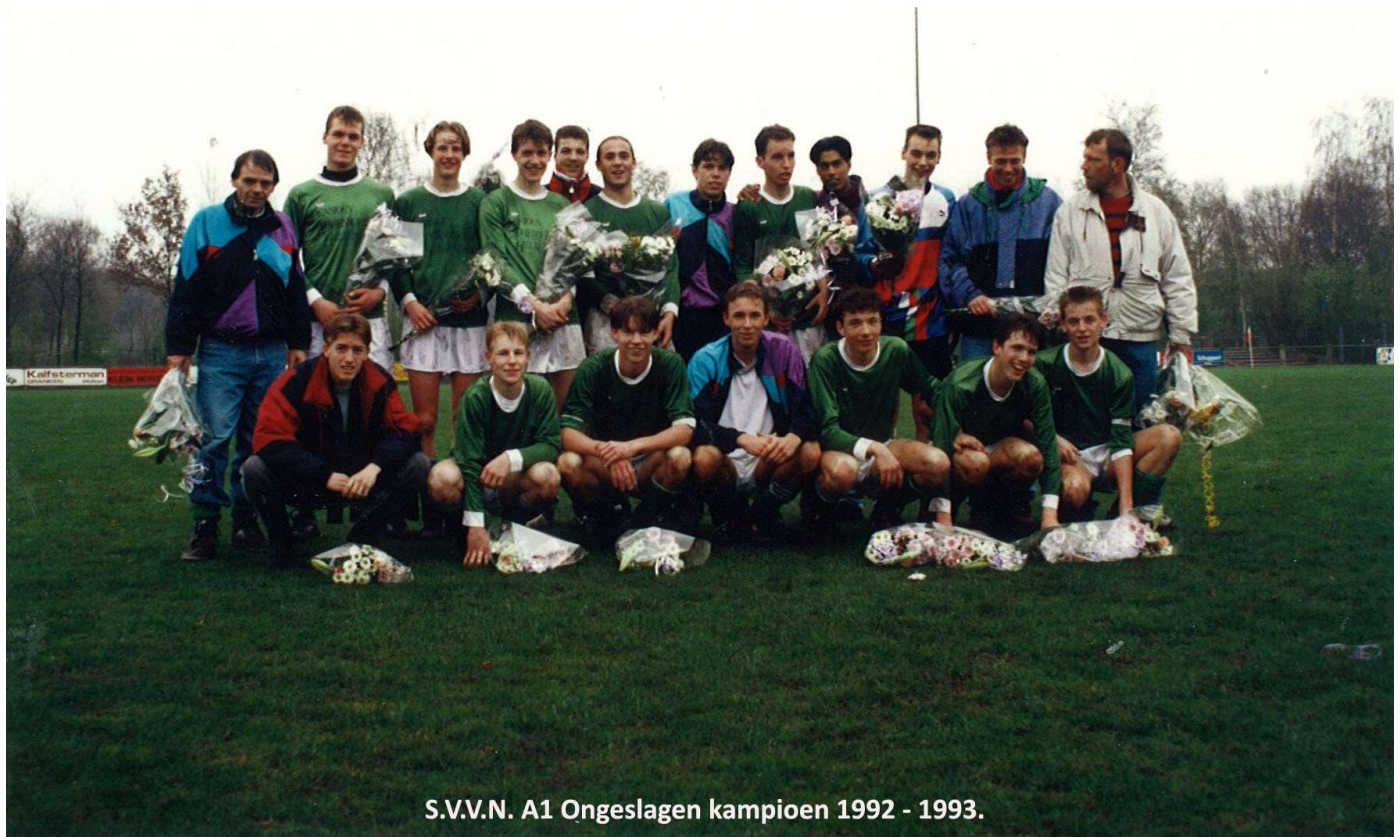
S.V.V.N. A1 Ongeslagen kampioen 1992 - 1993.